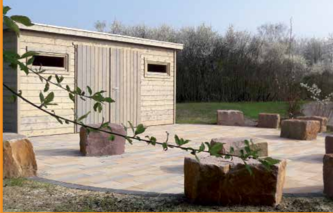
3. Bauabschnitt: Der Naturerlebnispfad

Starker Partner bei der Neugestaltung des Außengeländes: Das Großprojekt HOLA-Campus benötigt in den nächsten Jahren neben tatkräftiger Unterstützung der Schulgemeinde auch hohe finanzielle Mittel. Jede Spende zählt – helfen Sie uns, für Ihre Kinder den neuen HOLA-Campus zu verwirklichen.