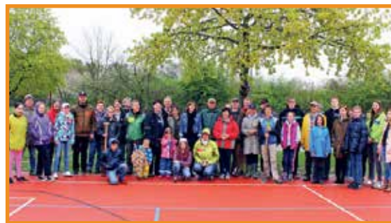
Pflanztag rund um das Multifunktionssportfeld